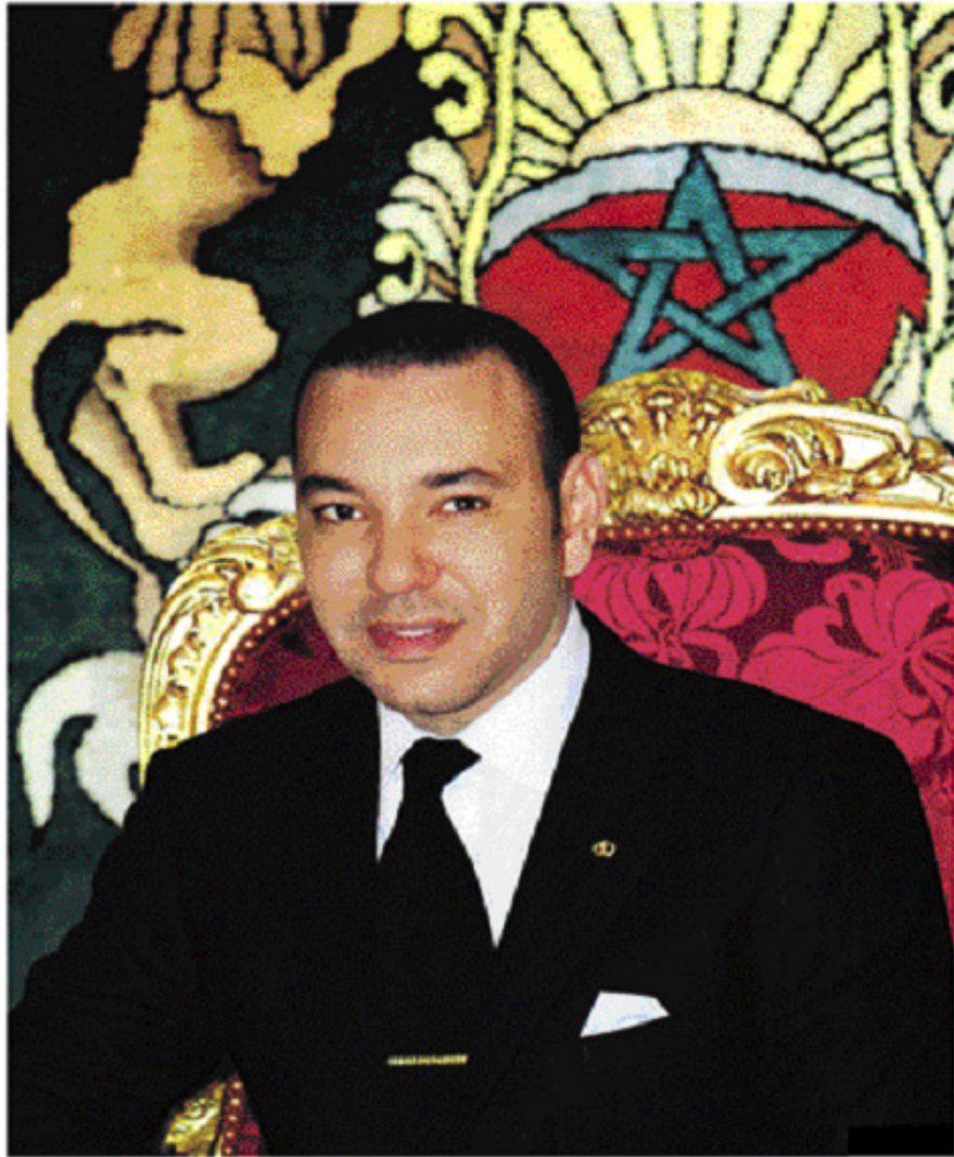
Sa Majesté le Roi Mohammed VI que Dieu l'Assiste