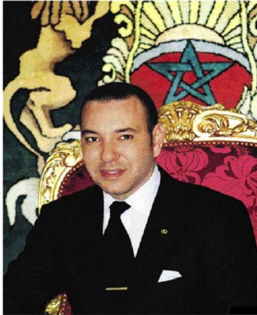
Sa Majesté le Roi Mohammed VI que Dieu l'Assiste